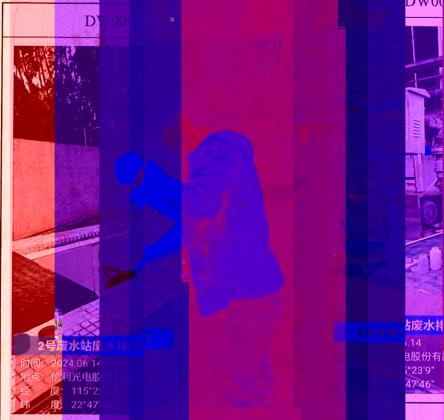
2号废水站废水排放口

时间: 2024.06.14 地点: 信利光电股份有限公司 经度: 115°23'37" 纬度: 22°47'01"